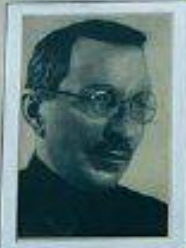
Макаренко Антон Семёнович

"Если педагогика хочет воспитывать человека во всех отношениях, то она должна прежде узнать его тоже во всех отношениях"