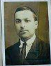
Выготский Лев Семёнович

"В общении педагогика есть самая диалектическая, подвижная, самая сложная и разнообразная наука. Вот что утверждением является основным смыслом нашей педагогической веры"