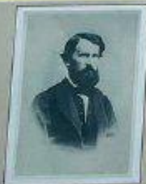
Ушинский Константин Дмитриевич

"Если педагогика хочет воспитывать человека во всех отношениях, то она должна прежде узнать его тоже во всех отношениях"