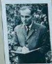
Сухомлинский Василий Александрович

"Необходимо иметь высказание на первом этапе момента онтологического развития ребенка, признать ведущую роль в развитии ребенка за развитием его социального поведения, его личности..."